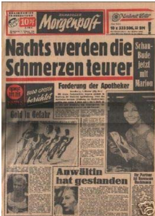
Abb. 2: Schriftzug "Morgenpost" in den 50er Jahren (Urheberschutz abgelehnt)

Schutzfähig dürften daher nur ungewöhnliche Schriften sein, die weit über die übliche Linienführung hinausgehen und das Ergebnis einer individuellen, kreativen Entfaltung des Entwerfers sind. Die nachfolgend abgebildeten Schriftbeispiele dürften die Hürde zum Urheberschutz durchaus nehmen: